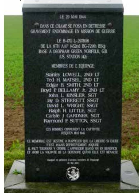
Stèle commémorant l'atterrissage de fortune d'un bombardier B17 à Petit-Leez.