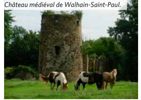
Château médiéval de Walhain-Saint-Paul.