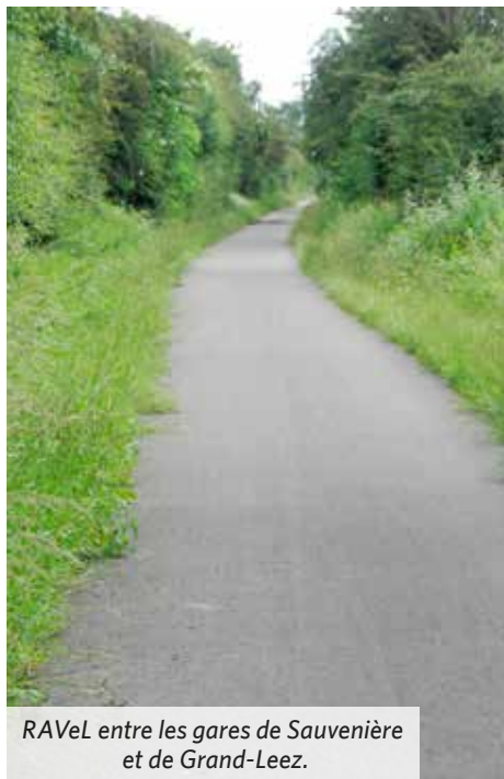
RAVeL entre les gares de Sauvenière et de Grand-Leez.