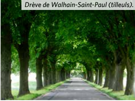
Drève de Walhain-Saint-Paul (tilleuls).