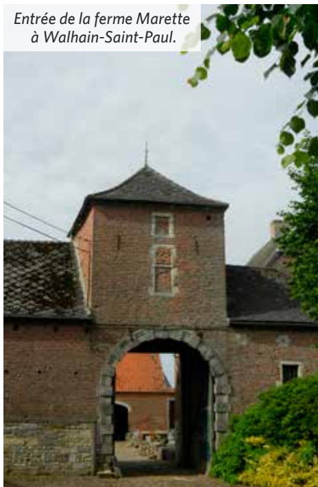
Entrée de la ferme Marette à Walhain-Saint-Paul.