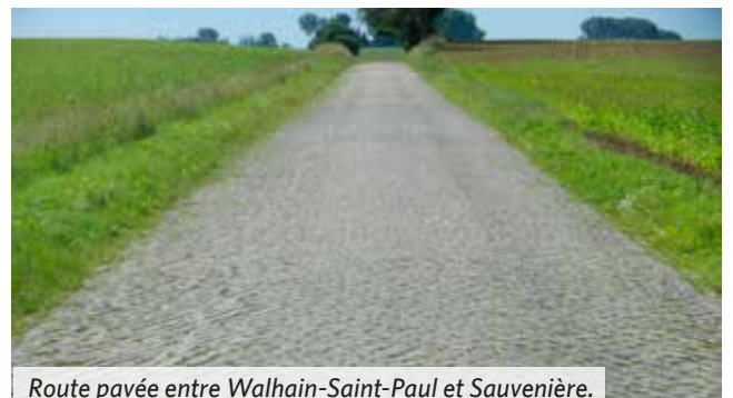
Route pavée entre Walhain-Saint-Paul et Sauvenière.

La randonnée que nous proposons est intéressante d'un point de vue culturel, paysager et patrimonial. Elle emprunte une section de la Route de l'armée Grouchy, entre Walhain (village de Walhain-Saint-Paul) en province de Brabant et La Bruyère (village de Saint-Denis) en province de Namur, soit 16,5 km hors liaisons. Walhain-Saint-Paul est facilement joignable en train, par la gare de Chastre [D] - sur la ligne Bruxelles - Namur (liaison : 2,6 km.). La promenade s'achève à la gare de Beuzet [A] (commune de Gembloux) sur le même axe Namur - Bruxelles (liaison : 2 km). L'itinéraire compte ainsi 21,1 kilomètres - liaisons comprises. Plusieurs raccourcis sont possibles, vers les gares de Gembloux 6 ou de Lonzée 7 : voir in fine . Le terrain est facile et les dénivelés minimes. Le parcours emprunte des voies (asphaltées, bétonnées ou pavées) sillonnant les paysages ouverts des vertes et riches campagnes hesbignones autour de magnifiques fermes en carré.