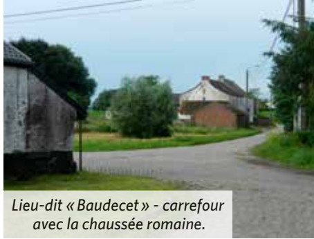
Lieu-dit « Baudecet » - carrefour avec la chaussée romaine.