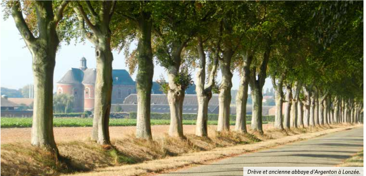
Drève et ancienne abbaye d'Argenton à Lonzée.