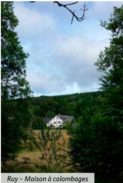
Ruy - Maison à colombages

Raccourci: en suivant les balises blanc et rouge du GR 5, il est possible d'éviter le passage par Chevrouheid en montant directement vers Andrimont. Le tracé de la RB complète se retrouve avant Andrimont, un peu avant que le GR ne tourne à droite vers le village. Vous marcherez 3,7 kilomètres en moins.