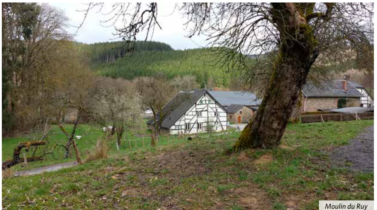
Moulin du Ruy