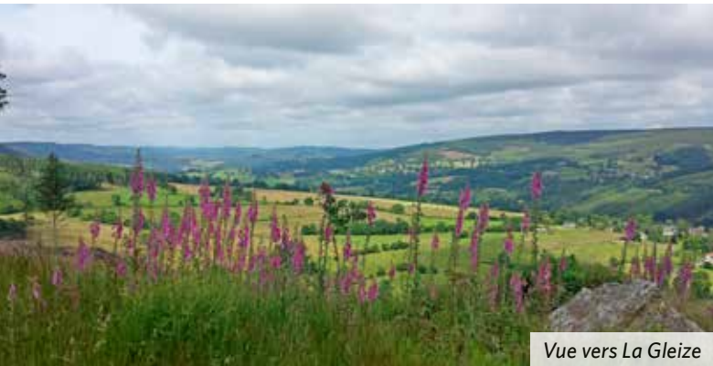
Vue vers La Gleize

nuez tout droit avec le blanc et rouge alors que les rectangles jaunes s'en vont à droite. Court tronçon asphalté pour passer les quelques maisons du bas d'Exbomont et, à un petit carrefour, vous vous enfoncez tout droit dans un sombre chemin caillouteux sous les frondaisons. À un T, tournez à droite (vous êtes à nouveau sur la balade locale rectangles jaunes, mais à contresens). Vous coupez la petite route d'accès au hameau de Roumez et poursuivez la descente sur un agréable chemin herbeux. Après une courbe à gauche, franchir le Roannay sur une passerelle, où nous sommes à une altitude de 300 mètres. Remonter jusqu'à la route du fond de la vallée, au village de Ruy .